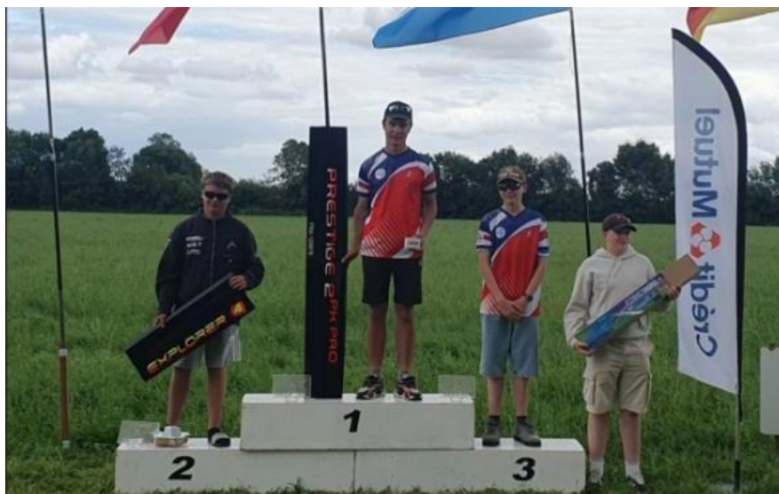
Euro tour F5J ANGERS FRANCE