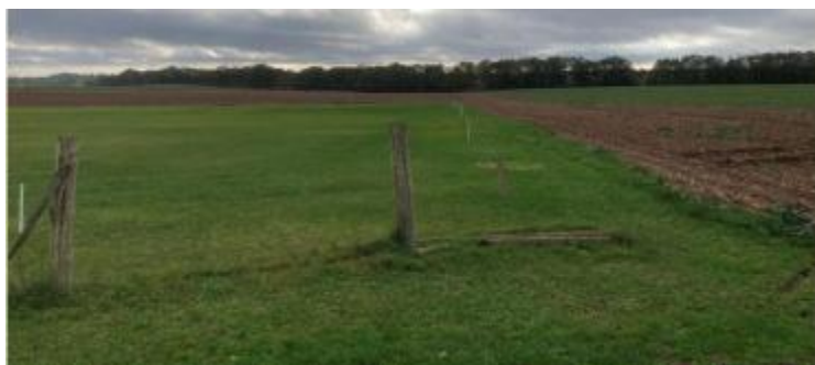
ETAT FIN 2023

Chaque année, notre terrain voit sa superficie diminuer par le non respect de ses limites. Il faut rester vigilant et prévenir notre propriétaire qui reste notre seul interlocuteur et intervenant pour éviter tout conflits avec le voisinage.